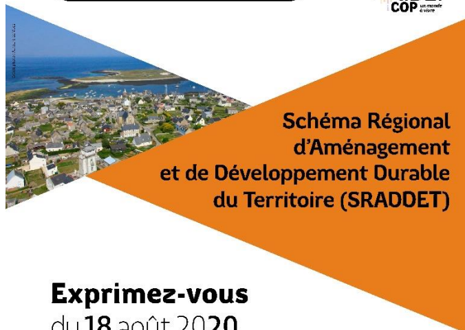
Schéma Régional d'Aménagement et de Développement Durable du Territoire (SRADDET)