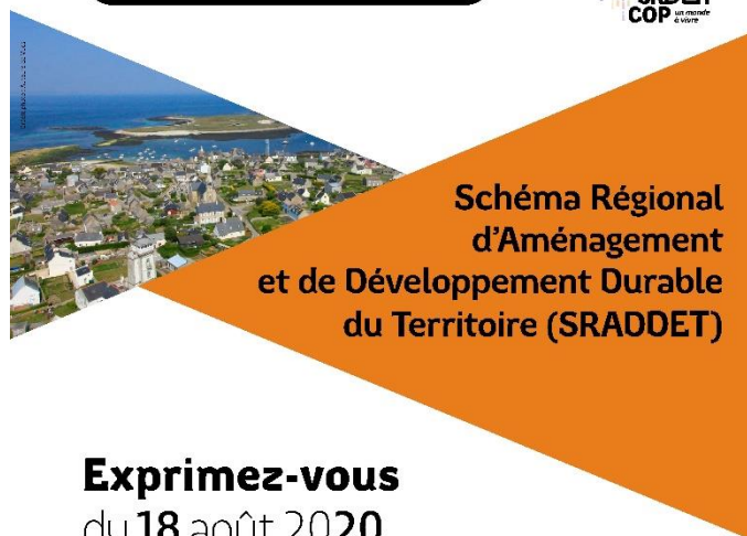
Schéma Régional d'Aménagement et de Développement Durable du Territoire (SRADDET)

Exprimez-vous du 18 août 2020 au 18 septembre 2020 ↙